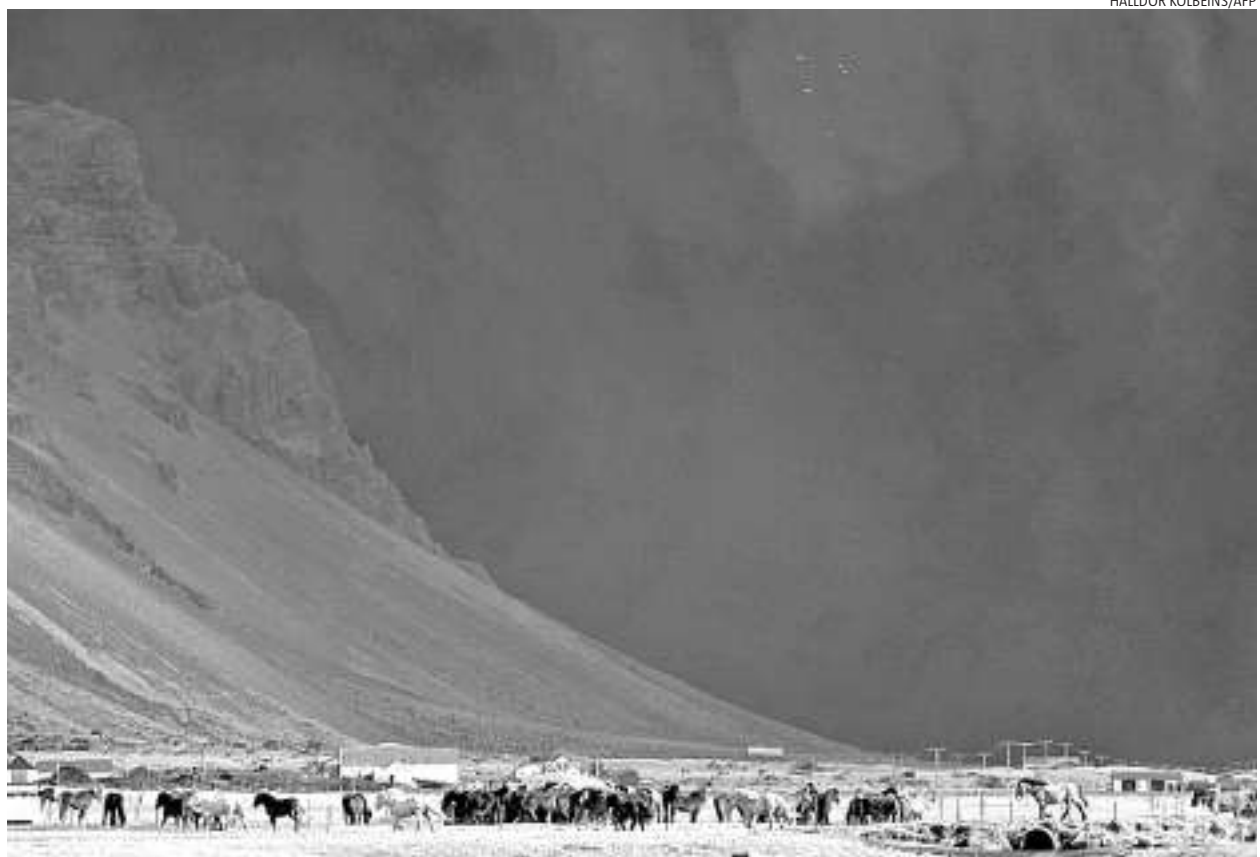
Vulcão Eyjafjallajökull mudou a paisagem da Islândia e interferiu na vida de todo o continente europeu nas últimas semanas

ÁRVORE E RIO A simbologia das viagens é antiga. Já no Antigo Testamento somos postos frente aos irmãos Abel e Caim. Um é pastor de rebanhos, o outro é ho-